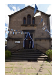
Ο Αγ. Φρουμέντιος