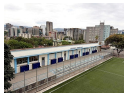
Το Μίχειο Γυμνάσιο – Λύκειο