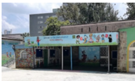
Το Διαμάντιο Νηπιαγωγείο

Εκφράζοντας την αγωνία μας η Γενική Συνέλευση του Σ.Ε.Α. ενέκρινε το ψήφισμα που φέρεται παρακάτω.