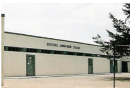
Το Ζέκειο Δημοτικό