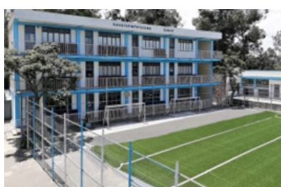
Η Καλογεροπούλειος Σχολή