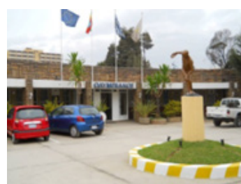
Η ΕΑΕ «Ολυμπιακός»