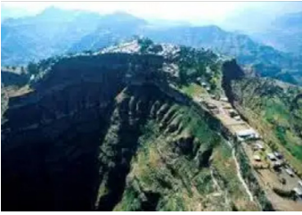
Το μοναστήρι Guishen Mariam

ήρθε σε επαφή με τη δυτική κλασική μουσική και σε ηλικία 8 ετών άρχισε να παίζει βιολί και πιάνο.